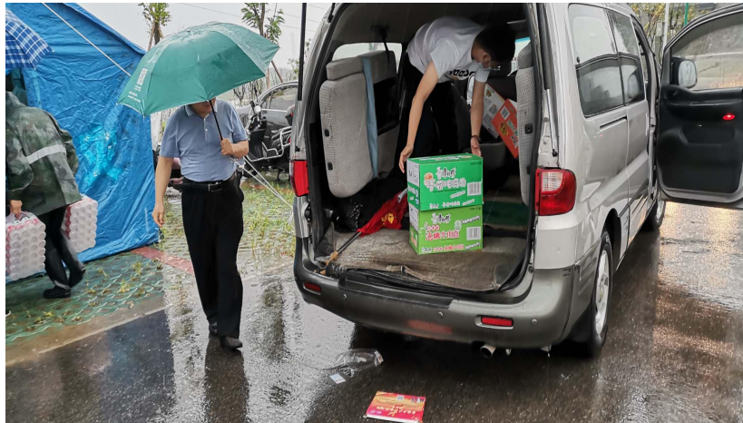
公司员工参与公益活动